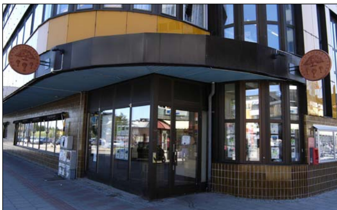
Entrépartiet idag, från norr. Nbm acc.nr 2004-103-04

Om- och tillbyggnaden 1987 innebar också en förändring av entrépartiet. Det aluminiumkantade "tak" som funnits sedan huset uppfördes och sträckt sig över entrén och längs hela nordvästfasaden byggdes om. Det kortades för att ge plats för tillbyggnaden och nu eller senare har det också försetts med en kraftigare kantplåt än det hade på nybyggnadsritningar. I entréns nordvästra hörn fanns tidigare också en rund pelare. Själva entrén var ursprungligen mer indragen än den är idag och den klinkerklädda pelare som idag står