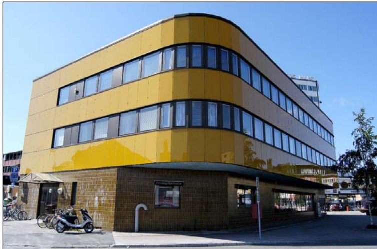
Byggnaden betraktad från öster. Här syns flera av de element som bidrar till det horisontella intrycket. Fönstrens proportioner minskar över hörnet, en detalj som väl samspelar med fasadens välvning.

Foto från söder, över byggnadens enda raka hörn. Nbm acc.nr 2004-103-07