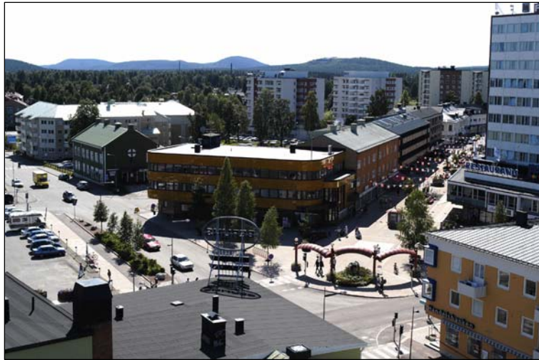
Foto från taket på Bodens kommunhus, från norr. Banken i centrum och till höger Drottninggatan och Folkets hus, till vänster Kyrkgatan.

Eftersom läget är det kanske mest centrala i staden, omges byggnaden av stadsmiljö och alla dess ingredienser som trafik, höga ljudnivåer och livlig gångtrafik. Kungs- och Kyrkgatan är öppna för biltrafik medan Drottninggatan är gågata. På Medborgarplatsen finns en mindre parkmiljö med träd och bänkar. Medborgarplatsen och Drottninggatan har stenläggning i grått och rött. Banken står relativt flackt i en generell sluttning mot Bodån i söder.