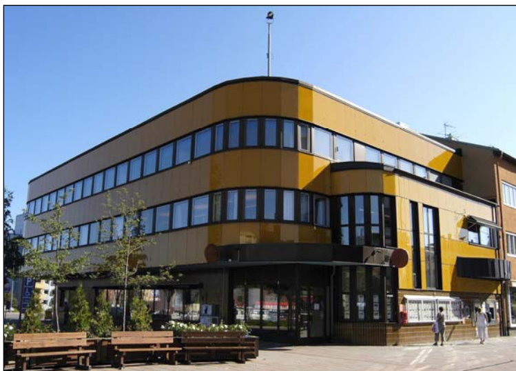
Översikt från norr. I förgrunden Medborgarplatsen.

Byggnaden har ett enhetligt uttryck och domineras av sin fasad. Den har en horisontal uppbyggnad med en låg, utsträckt form, långa fönsterband samt en vågrät fasadindelning, uppnådd genom den höga klinkerklädda sockeln. Den enda vertikala strävan kan urskiljas i den tillbyggda delens stående fönster och höga, smala form. Tillbyggnaden bryter också bankens i övrigt så helgjutna gestalt, samtidigt som den fullt ut upptagit huvudbyggnadens karaktäristik i material, proportioner och uttryck.