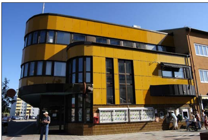
Tillbyggnaden för trapphus och automater på nordvästfasaden.