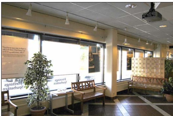
Del av banklokalens interiör. På bilden syns det stenlagda golvet, innetaket, den glasade nordostväggen, inredningen och två av de bärande, vitmålade betongpelare.

I stort sett allt i interiören är förändrat sedan uppförandet. Banklokalen har en neutral utformning med vita väggar och ljusa trädiskar. Golvet består av lagda stenplattor, rutmönstrat i rött och ljusgrått och kan eventuellt vara ursprungligt. Entréplanet planlösning är enkel och öppen. Här finns en lång kassadisk med och några bänkar för väntande kunder. I lokalens södra del finns även administrativa utrymmen. Till höger om entrén finns den tillbyggda trappa som leder till övre plan och höger om denna finns en vitmålad hiss, även den i utbyggnaden men av ännu senare datum.