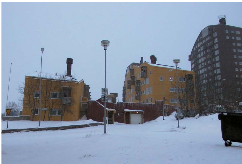
Berlinmuren, mullbänken och snusdosan. Nbm acc.nr 2002-34-07.

Mitt emot den vägen mynnar en gågata ut på torget och det finns även några smalare gångvägar till torget. På parkeringen står ännu en skulptur och denna är av järn. Torget omgärdas av affärer och banker.