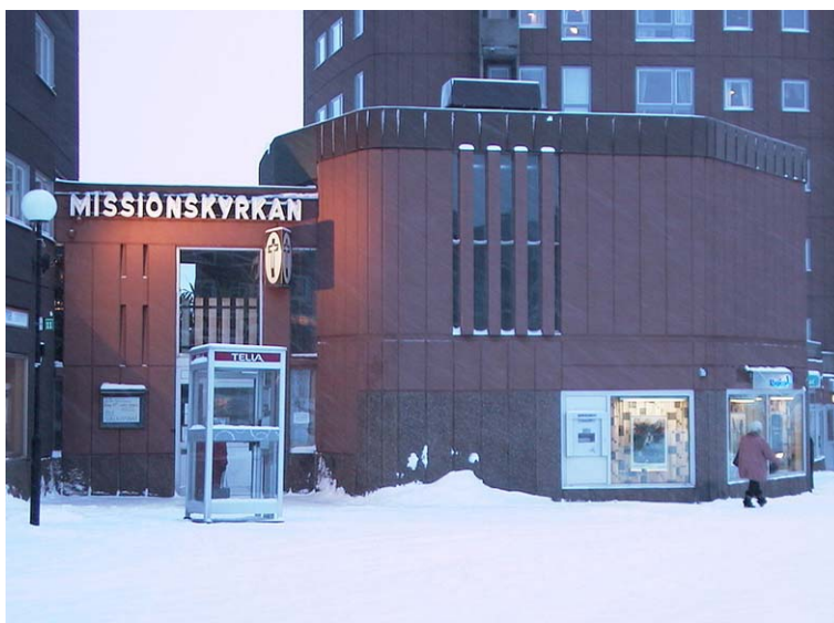
Missionskyrkans exteriör. Nbm acc.nr 2002:33:06.

I samband med att området byggdes revs en kyrka, vilket ledde till att Ralph Erskine ritade en kyrka i det nybyggda området. Kyrkan tillhör Missionskyrkan och är placerad ut mot torget mellan tygaffären och Nordea. Färgen på kyrkan och den lägre byggnadslängan är något rödare och ljusare än de övriga bruna husen.