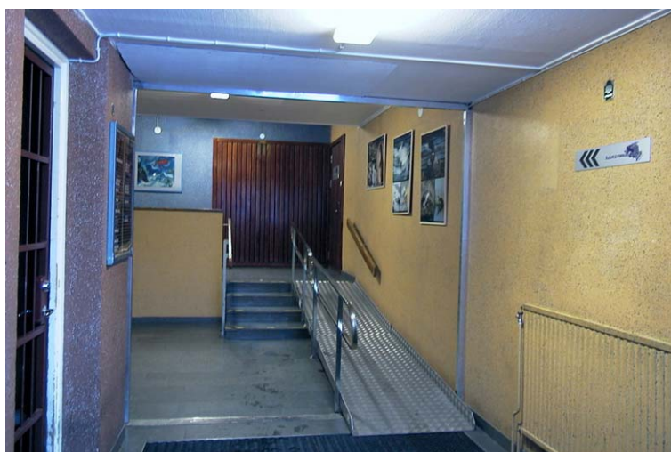
Trapphus i kvarteret Ortdrivaren. Nbm acc.nr 2002:33:12

I trappuppgångarna finns dubbla dörrar med en värmesluss i mellan och så var det redan vid byggtiden. Den yttre dörren är utbytt från en trädörr till en aluminiumdörr, medan den inre dörren fortfarande är av trä med glasade partier. Ovanför den inre dörren finns ett smalt liggande fönster en bit upp på fasaden. Den yttre dörren omsluts av betongväggar med utstansade hål i den råa betongen. Trapphuset har stentrapp och stålräcken överdragna med plast. I entrén är väggarna utsmyckade med ett grönt stänkmåleri direkt på betongen och på de övriga våningarna finns en storblommig tapet i två färgvarianter, i grönt respektive i brunt. Samma tapet återfinns i de övriga husen och enligt fastighetsskötaren så tillkom den på 1970-talet.