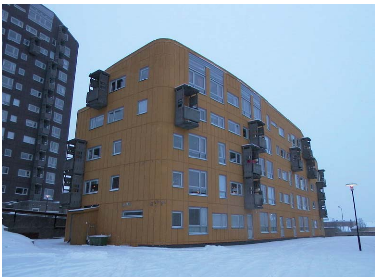
Mullbänken från gården. Nbm acc.nr 2002:33:16.

Baksidan på Hus 2 och husen 3, 4 och 5 bildar tillsammans ett gårdsrum. På gården finns en lekplats och några få parkeringsplatser. Parkeringsplatserna är nya inslag och fanns inte där vid byggtiden. Det är en asfalterad yta som känns inramad och har en privat karaktär. Hus tre kallas Mullbänken och är byggt som ett sutterränghus med olika höjd. Det är som högst mot gården där det är fem våningar högt. Framsidan på hus 3 och baksidan på hus 1 bildar ett mindre uterum med piskställningar.