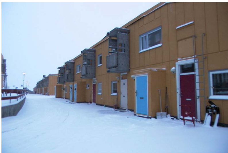
Berlinmuren från gården. Nbm acc.nr 2002:33:05.

Husen ger nästan sken av att hänga ihop men det är två fristående hus även om de till utseendet är mycket lika. Längs Hjalmar Lundbomsvägen är husen indragna i gatulivet på samma sätt som de äldre husen längre ned på gatan, vilket ger en kontinuitet och harmoni åt gatan. Hus 5 är längre än hus 4, mot innergården två våningar höga.