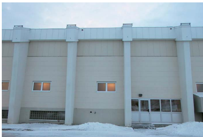
Exteriör, idrottshallens baksida med ljus Gulmålad betongfasad och strävpelare. Nbm acc.nr 2002-30-04.

Den södra långsidan har samma fasadmateriell som de övriga sidorna, nämligen vitmålad gjutna betongelement som är lagda horisontellt. Den övre delen av fasaden har vertikala plåtribbor. Fasaden är uppdelad av nio strävpelare och en grund av grå slätputs. Innanför varje strävpelare finns två fönster av aluminium. Det är åtta sådana fönstergrupper, men den sista av dem har en dörr istället för ett av