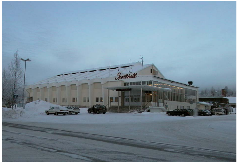
Idrottshallens exteriör och entré. Nbm acc.nr 2002-30-06.

Utanför entrén finns en stor parkering samt busstationen och parkeringen ramas in av hyreshus, posten samt järnvägsgatan.