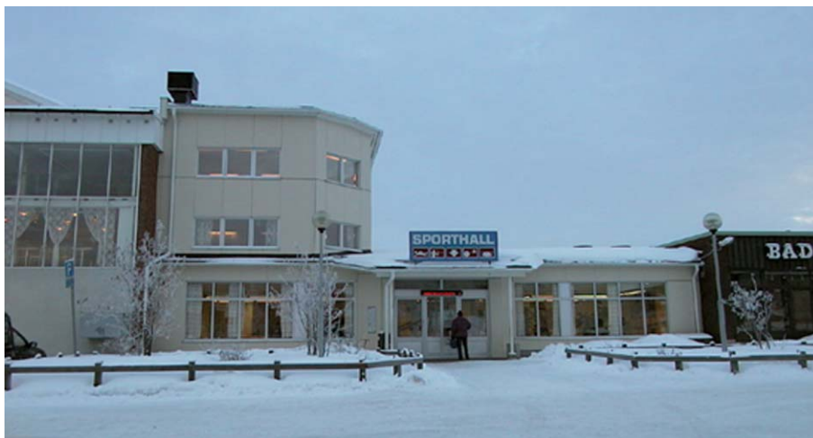
Nuvarande entré till sporthall och badhus

till kvällsidrott. En ventilationsanläggning i grå plåt hänger på väggen. De tre sista indelningarna mot den östra gaveln har i grunden långsmala fönster med glasbetong.