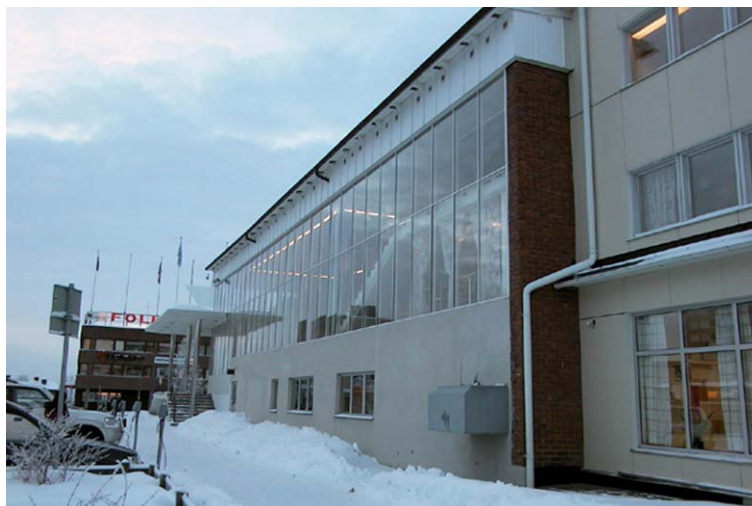
Fasad mot parkeringen. I bakgrunden Folkets hus. Nbm acc.nr 2002-30-13.

Den östra gaveln står ut ca 1 meter från förbindelsebyggnaden och där blottas rött tegel. Östra gaveln är den fasad som har förändrats allra mest sedan uppförandet och den består till största delen av glas. Idag består fasaden av en aluminiumdörr för personalen, tre fönster och en glasvägg.