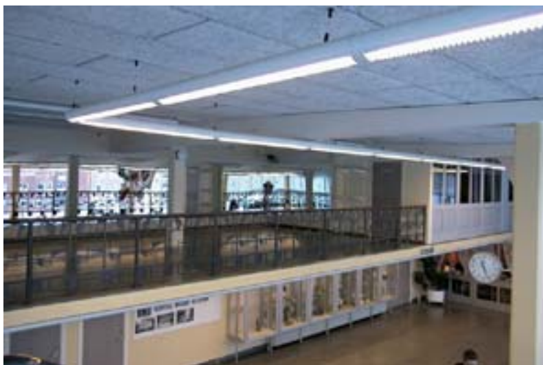
Ovan: Entréhallen. Nbm acc.nr 2002-31-10.

Undre källarplan innehåller en nio banors bowlinghall, styrketräningslokal och C-hallen. På det övre källarplanet eller det nya huvudentréplanet finns B-hallen som används av fysioterapin och personalutrymmen.