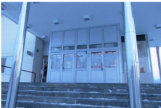
Gamla huvudentrén. Nbm acc.nr 2002-30-16.

Idag används inte den ursprungliga huvudentrén som annat än en vanlig entré och biljettkassan är flyttad till förbindelsebyggnaden mellan sporthallen och badhuset. Den ursprungliga