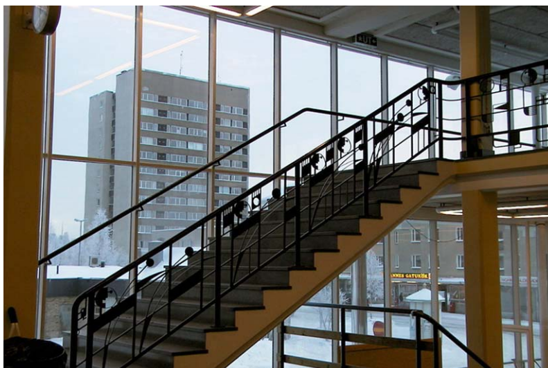
Ovan: Trappa i entréhallen. Nbm acc.nr 2002-31-10.