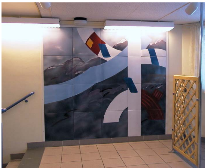
Emaljkonst i trapphuset. Nbm acc.nr 2002-31-06.