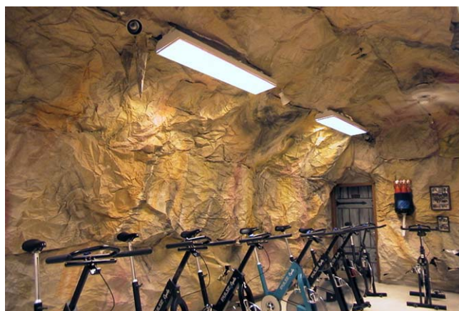
Spinninghallen.