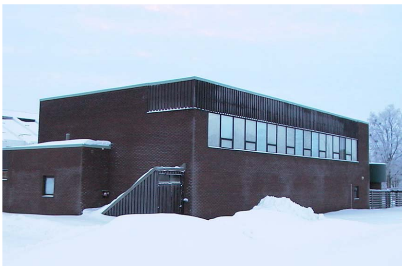
Badhuset, exteriör. Nbm acc.nr 2002-32-01.

Intressant är också badhuset som byggdes av samma arkitektkontor och sedan 1983 är sammankopplat med sporthallen. Det är två mycket olika byggnader där sporthallen har en ljus och lätt arkitektur och badhuset en mörk och tung. Badhuset är byggt i mörkt tegel med få fönster och sporthallen med ljust målade betonelement och sporthallen är mycket högre och rymligare än badhuset. Trots olikheterna kompletterar