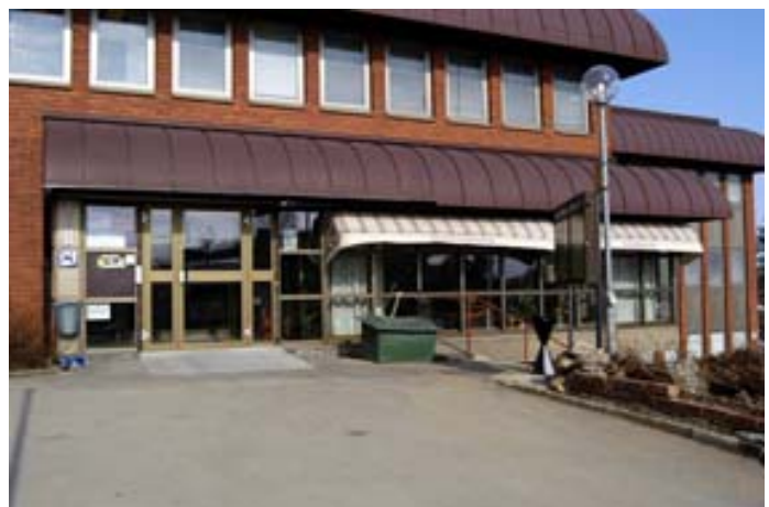
Acc.nr 2004:97:13. Huvudentrén.

Huvudentrén till kommunhuset är vid sydvästra sidan, vid Tingshusvägen. Ännu en entré finns vid sydöstra gaveln, som leder direkt till en kontorskorridor. Entrepartierna är försedda med skärmtak som har samma takfall som yttertaket. Foajén markeras med ett utbyggt glasparti.