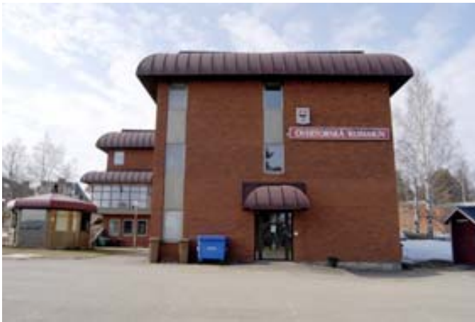
Acc.nr 2004:97:06. Sydöstra fasaden. Gavelentrén närmast i bild, till vänster skymtar foajén. Längst till vänster syns det tillbyggda rökrummet.

Parkeringsplatser finns sydost och nordväst om kommunhuset. Utanför byggnaden finns också en senare tillbyggd, åttkantig liten byggnad. Detta rymmer rökrummet. Utanför kommunhuset finns även särskilt byggda soprum.