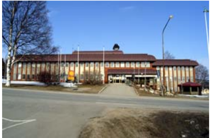
Acc.nr 2004:97:07. Entrésidan, mot sydväst.

Kommunhuset är uppfört i rödbrunt tegel. Fönsterpartierna utgör dominerande inslag i fasaderna. De täcker stora delar av fasaden, och är horisontalt markerade genom att de utgör ljusa partier i den annars mörka byggnaden. Under glasrutorna är ljusst målade plåtpartier, som ytterligare förstärker detta.