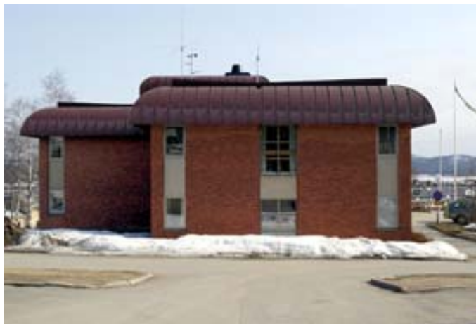
Acc.nr 2004:97:09. Nordvästra fasaden.

Kommunhuset är tre våningar högt, men delvis suterrängbyggt, där den nordvästra delen är inbyggd i backslutningen. Suterränglösningen är vald just för att terrängen annars gjort det svårt att bygga på tomten. 33 Byggnadens grundform är rektangulär, men med en förskjutning längs byggnadens längdaxel, så ungefär halva gaveln går längre ut än den andra på respektive sida. Taket är flackt, men takfallen är rundade, formen är avsedd att ge karaktär och pondus åt byggnaden. 34 Detta har enligt uppgift lett till att byggnaden kallas "loket", genom att det liknar ett sådant till formen. 35