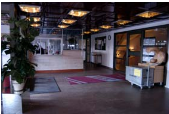
Acc.nr 2004:98:02. Receptionen vid huvudentrén.

Genom huvudentrén kommer man in på plan 2. Där finns reception, liksom ett utrymme med sittmöbler, kapprum och toaletter för besökare.