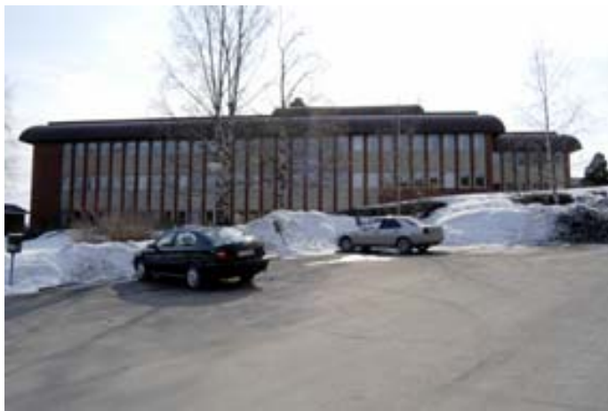
Till vänster: Acc.nr 2004:97:01. Nordöstra fasaden.