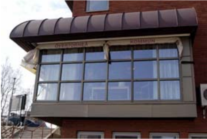
Acc.nr 2004:97:17. Del av foajén som ligger i anslutning till huvudentrén.