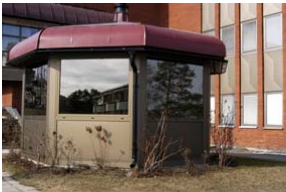
Acc.nr 2004:97:24. Rökrum.

Parkeringsplatser finns sydost och nordväst om kommunhuset. Utanför byggnaden finns också en senare tillbyggd, åttkantig liten byggnad. Detta rymmer rökrummet. Utanför kommunhuset finns även särskilt byggda soprum.