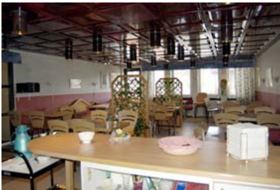
Acc.nr 2004:99:03. Personalens fikarum.