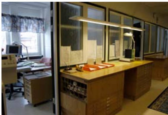
Acc.nr 2004:99:12. Tidigare konferensrum på plan 2, som byggts om till kontorsrum.

Tidigare fanns ett konferensrum även på plan 2. Detta har byggts om till kontor under 1980-talet. 36 Rökrummet som senare byggts till utanför kommunhuset har omvandlats till ett sammanträdesrum. Ny ventilationsanläggning installerades i början av 2000-talet. Ett återkommande problem har varit kommunhusets platta tak, som på vintern inte har klarat av snön. Detta har föranlett att yttertaket har bytts, på grund av läckage. I övrigt har uppfräschning av ytskikten gjorts vid behov. Under 2003 byggdes entrén till socialkontoret om, och försågs med larm och kodlås.