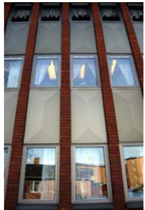
Till höger: Acc.nr 2004:97:18. Detaljbild på fönsterparti i nordöstra fasaden.

Huvudentrén till kommunhuset är vid sydvästra sidan, vid Tingshusvägen. Ännu en entré finns vid sydöstra gaveln, som leder direkt till en kontorskorridor. Entrepartierna är försedda med skärmtak som har samma takfall som yttertaket. Foajén markeras med ett utbyggt glasparti.