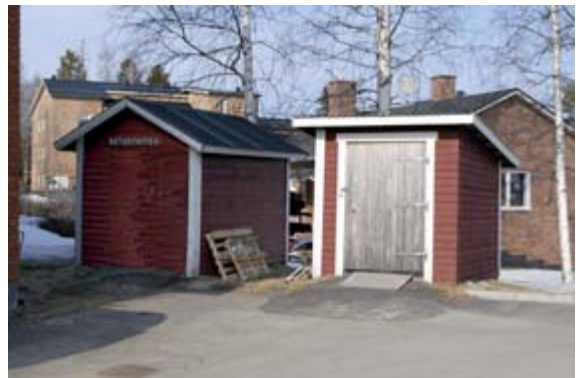
Acc.nr 2004:97:28. Soprum.