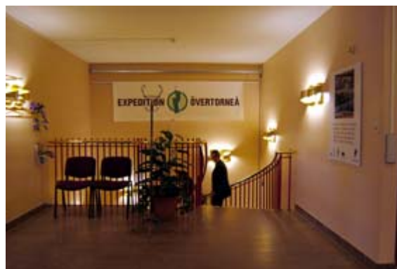
Acc.nr 2004:99:19. Trapphuset, plan 3.

Trapphuset är försett med ljust aprikosfärgade vävtapeter. Den rödmålade hissen kontrasterar dessa. Ekdörrar leder till toalettutrymmen, medan övriga dörrar, som leder till kontorskorridorer och fikarum är utförda i brun aluminiumprofil. Själva trappan leder uppåt och nedåt i en halvcirkelformad svängning. Ett flertal av armaturerna i trapphuset är, liksom bland annat i konferensrummet, utförda i mässing och kontrasterar därmed till den övriga ”kontorsbelysningen”.