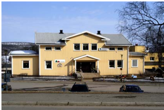
Acc.nr 2004:97:31. Kommunens tidigare förvaltningsbyggnad.

Innan dagens kommunhus byggdes, var kommunens förvaltning inrymd i en betydligt mindre byggnad, som ligger snett mitt emot det nuvarande kommunhuset, på Sockenvägen 26. 30 Denna byggnad är en gul träbyggnad med sadeltak, och rymmer idag en förskola samt Studieförbundet vuxenskolan.