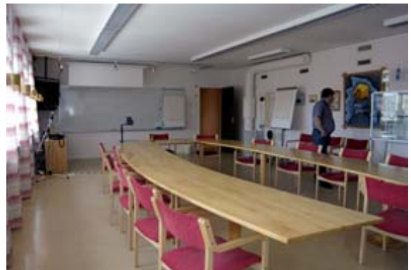
Acc.nr 2004:99:16. Sammanträdesrum på tredje våningen.