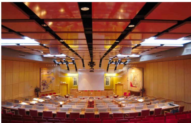
Sessionssalen. Nbm acc.nr 2003:111:1.

Innanför entréhallen återfinns sessionssalen. Salen har lutande golv och går igenom både plan 1 och 2. Rummet har 78 arbetsplatser för politiker, 176 publikplatser, ramp med 15-20 handikapplatser samt 8 arbetsplatser för pressen. Färgmässigt domineras rummet av de röda fåtöljerna. Väggarna är klädda med ljus björkpanel och det nedsänkta taket är vitmålat. Ljusinsläpp sker genom 6 av takets 8 lanterniner. På plan 1 återfinns skyddsrum och verkstadsutrymmen intill sessionssalen medan den på plan 2 omges av bibliotek och sammanträdesrum. Väster om sessionssalen i 2-våningsdelen finns motionsrum på det nedre planet och café/matsal i det övre.