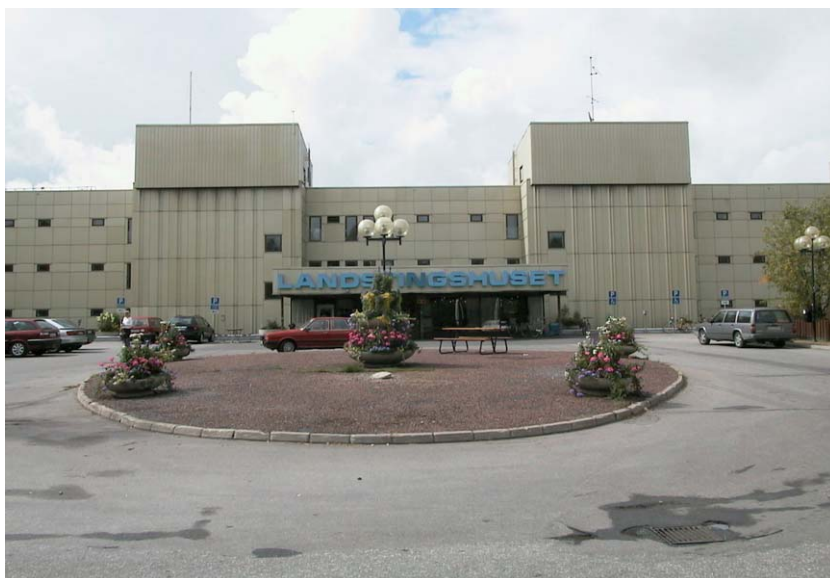
Landstingshusets entré. Fotograf: Henrik Åsenius, Acc.nr, Nbm 2002:53:01.

Under 1900-talet växte den svenska välfärdsstaten fram. I takt med detta utökades de områden och deras omfång där samhället blev huvudansvarig för verksamheterna. Många kommuner och landsting blev trångbodda och/eller fick sina verksamheter och administrationer utspridda med försämrad effektivitet som följd.