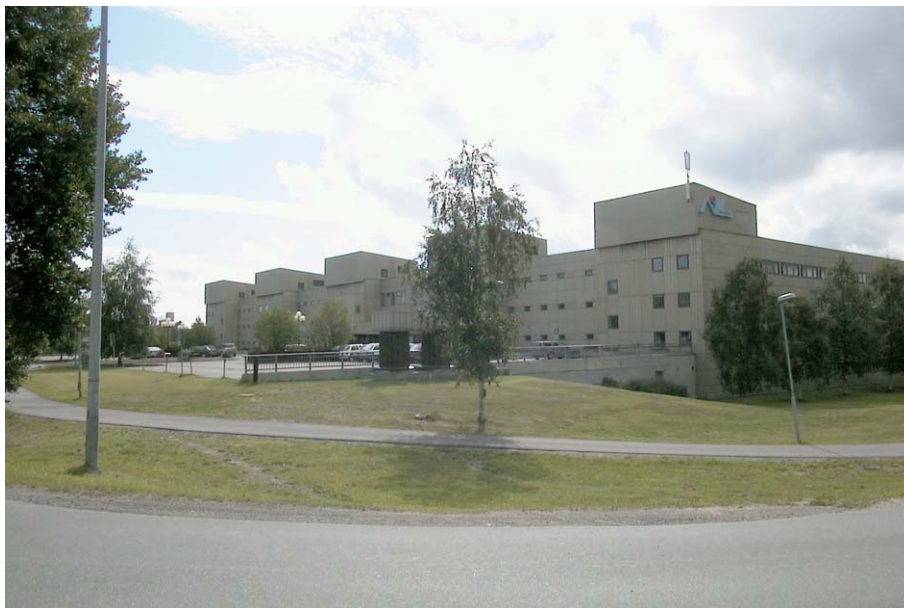
Byggnaden fotograferad från nordöst. Acc.nr: Nbm 2002:53:03

De fem fyrvåningsflyglarna är orienterade i öst-västlig riktning och binds vinkelrätt ihop med sammanbindningsflyglar i de övriga flyglarnas östra delar. Flyglarna littereras A-E söder ifrån och är placerade på ca 15 m avstånd från varandra. Flyglarnas planmått är ca 44 x 11 m. Sammanbindningsflyglarna är ca 7,5 m breda. Andra och tredje flygeln från norr räknat binds i de två nedre planen samman av en lägre 2-våningsbyggnad som i väster är ca 22 m längre än de övriga flyglarna. Denna den lägre byggnadsdelen var ursprungligen tänkt att bli byggnadens symmetriaxel. Men under byggnadens uppförande tillkom den södra flygeln benämnd A, på situationsplanen benämnd tillbyggnad. I östra änden på den ursprungligt tänkta symmetrilinjen återfinns entrén. I anslutning till denna har en av Sveriges större bankkoncerner en uttagsautomat.