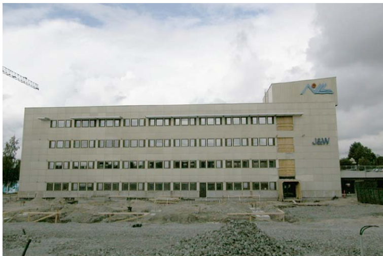
A-flygelns sydfasad fotograferad från söder. Fotograf: Henrik Åsenius, Acc.nr: Nbm 2002:53:17

Under uppförandet av landstingshuset utökades byggnaden med en extra flygel, den södra benämnd A, av samma utförande som de övriga. Invändigt har väggar målats om eller fått nya tapeter. Heltäckningsmattorna i kontorsrummen och i korridorerna utanför dessa har ersatts med linoleummattor. Ny teknik har gett upphov till nya installationer. Mycket av teknikininstallationerna finns i sessionssalen.