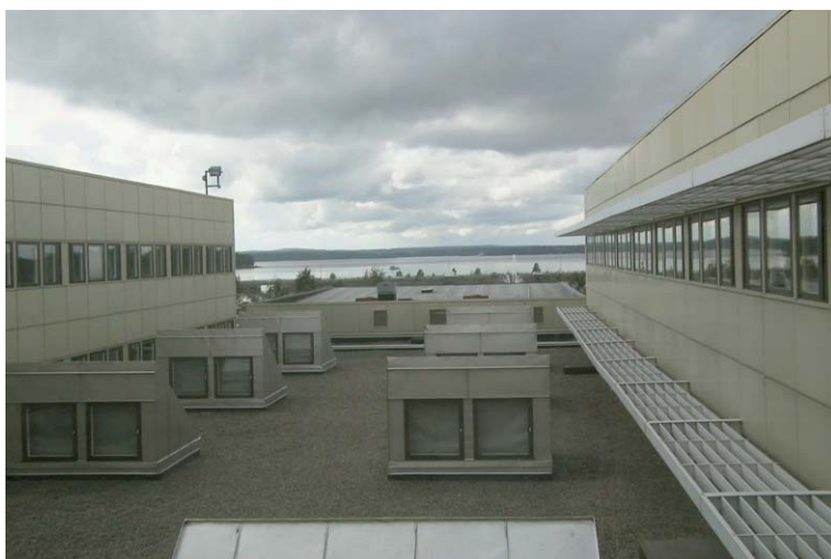
Sessionssalstaket fotograferat från väster. Fotograf: Henrik Åsenius, Acc.nr: Nbm 2002:53:10.

Flyglarna har sinsemellan olika färgmarkeringar på väggar, trappdetaljer etc. för att underlätta för besökare att orientera sig i byggnaden. Kontorsarbetsplatser är samlade i flyglarna på ömse sidor om i flyglarnas mitt löpande korridorer. Huset byggdes med 224 arbetsplatser förlagda till i princip lika stora arbetsrum, de minsta med måtten 4,20 x 3,45 m, som har en genomgående likartad inredning. Golven har linoleummattor som ersätter de ursprungliga heltäckningsmattorna, väggarna är klädda med svagt mönstrade tapeter i ljusa färger och undertakens skivor är vitfärgade. Kontorsrummen har möbler av trä som är relativt enkelt utformade. I anslutning till 23 arbetsrum finns lika många samtalsrum. Byggnaden inrymmer även 17 sammanträdesrum.