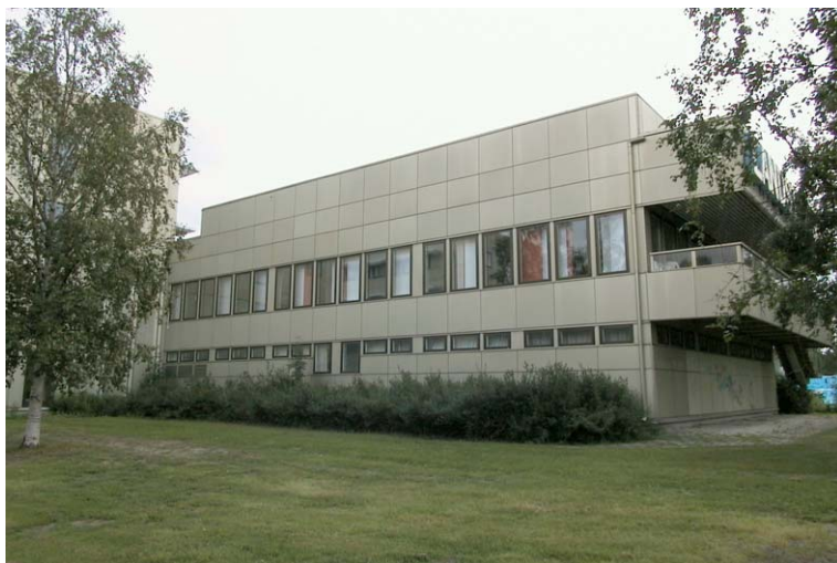
Nordfasad.

Byggnaden som uppfördes var stor till volymen från början, men utökades under byggandet med ytterligare en flygel. Den rationella stommen fick installationerna samlade i förbindelseflyglarna. Arbetsrummen blev i demokratisk anda nästan identiska till storlek och utförande, med utsikt mot vattenspegeln i väster. Ingen skulle behöva ha kyrkogården i öster som utsikt från sin arbetsplats. Detta var en anledning till att flyglarna med arbetsrum placerades i väst-östlig riktning på tomten. Huvudmotivet var dock att reducera solvärmeproblemen. Landstingshuset försågs även med motionsrum och matsal.