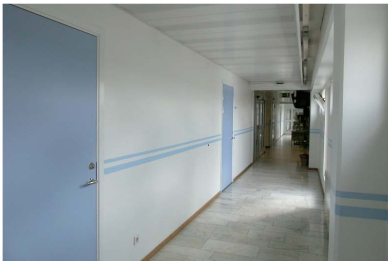
Korridor i förbindelseflygel. Acc.nr: Nbm 2002:53:24.

Våtutrymmena är tillsammans med kapprum, personal- och vilrum, hissar och trappor förlagda till de sammanbindande flyglarna. I förbindelseflyglarna mellan kontorsflyglarna A-E finns glasade aluminiumpartier. Byggnadens elradiatorer är vitlackerade i likhet med invändiga snickerier. Golvsocklarna är dock klarlackade. A-flygeln är för närvarande utrymd p.g.a. den påbörjade tillbyggnaden i söder.