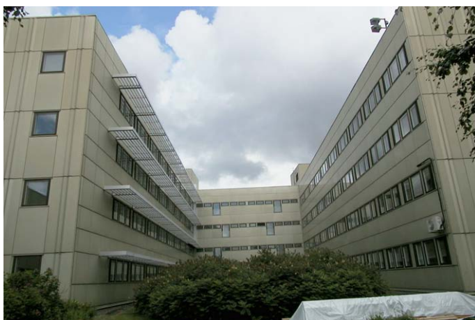
Flyglarna B och C fotograferade från väster. Acc.nr: Nbm 2002:53:12

Hela byggnaden är inklädd med grönfärgad aluminiumplåt. Ursprungligen var byggnadens eloxerade aluminiumplåtar champagnefärgade, men dessas kulör har med tiden förändrats. Fönstren på flyglarnas nord- och sydfasader sitter i horisontella band. Övriga fasader har glesare mellan fönstren, i några fall som på flyglarnas gavlar betongar fönstren istället vertikalt. De yttre bågarna är utvändigt klädda med brunfärgade aluminiumprofiler. Samma kulör har de glasade aluminiumpartierna vid entrén. På söderfasaderna sitter meterbredda solavskärmningar av lättmetall över fönstren. Yttertaken är pappklädda.